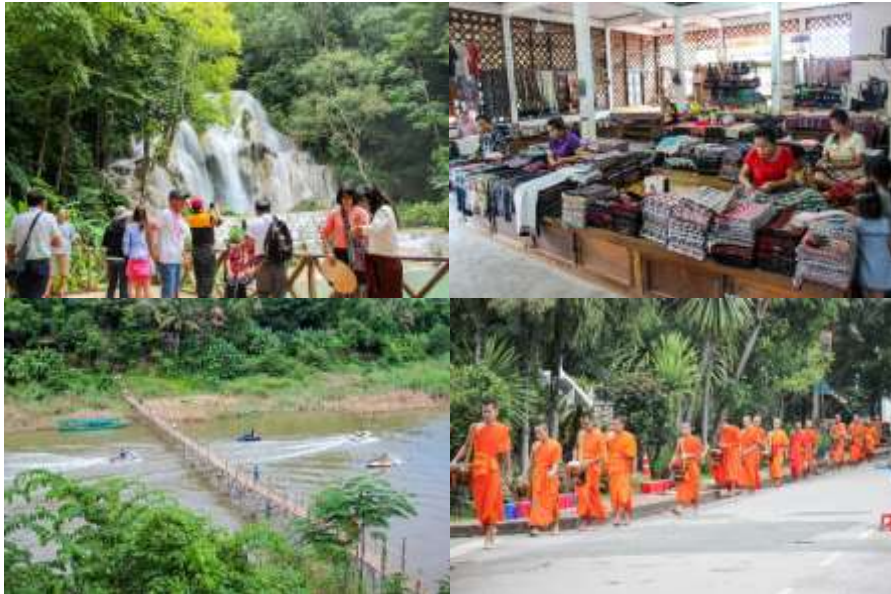
ภาพที่ 2 สภาพของการท่องเที่ยวในหลวงพระบางเมืองมรดกโลก ที่สำรวจในเบื้องต้นจะพบ การท่องเที่ยววัด พิธีกรรมทางศาสนา วิถีชีวิต น้ำตก ธรรมชาติ และการดำเนินชีวิต ผ่านศูนย์ศิลปหัตถกรรม เป็นต้น (ภาพคณะนักวิจัย: 12-15 กรกฎาคม 2561)