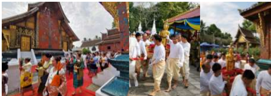
ภาพที่ 6 วัดศรีเมือง พิธีอัญเชิญพระม่านและพิธีสรงน้ำพระม่าน พระพุทธรูปศักดิ์สิทธิ์ คูบ้านคูเมือง ประจำหลวงพระบาง (ภาพ Online: 16 เมษายน 2562)

วัด (Nittha Bounpany, ชัยสิทธิ์ ด้านกิตติคุณ, 2561: A55-A70; พระมหานิกร ฐานุตโตโร, 2559; Wantanee Suntikul, 2018) ประเพณีบิณฑบาต ที่เป็นจุดเด่นและภาพจำของชาวโลก (Wantanee Suntikul, 2018) ประเพณีทางศาสนา อาทิ สรงน้ำพระม่าน สงกรานต์ รวมทั้ง เนื่องด้วยสถานที่แหล่งท่องเที่ยวอื่น ๆ ตามที่ปรากฏในเอกสารของทางราชการ “Luang Prabang Province Tourism Destination Management Plan 2016 – 2018” (2016) ที่เข้าไปจัดการท่องเที่ยวและเสนอที่ท่องเที่ยวอื่น ๆ ที่เนื่องด้วยธรรมชาติ ป่า เขา น้ำตก และแหล่งท่องเที่ยวเชิงวัฒนธรรม เช่น หมู่บ้านชนเผ่าม้ง หมู่บ้านซ้าง เป็นต้น ให้เกิดการประสานเป็นรูปแบบการจัดการท่องเที่ยวอย่างเป็นระบบ