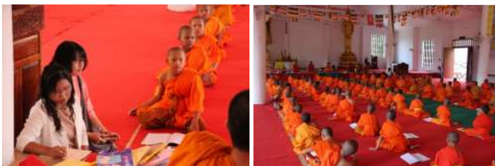
ภาพที่ 4 คณะนักวิจัยเก็บข้อมูลเกี่ยวกับการท่องเที่ยวเชิงวัฒนธรรมและศาสนาที่หลวงพระบาง (ภาพคณะนักวิจัย: 15 กรกฎาคม 2561)

การจัดการท่องเที่ยวในหลวงพระบาง เนื่องด้วยพระพุทธศาสนาและวัฒนธรรม ประเพณีพระพุทธศาสนา ดังปรากฏเป็นวัด เจตีย์ พระธาตุ พระพุทธรูป และประเพณีที่เนื่องด้วยพระพุทธศาสนา ทั้งการบิณฑบาตเช้า การสรงน้ำพระในช่วงสงกรานต์ การสวดสรงหรือเถราภิเษก ประเพณีบุญต่าง ๆ เป็นต้น