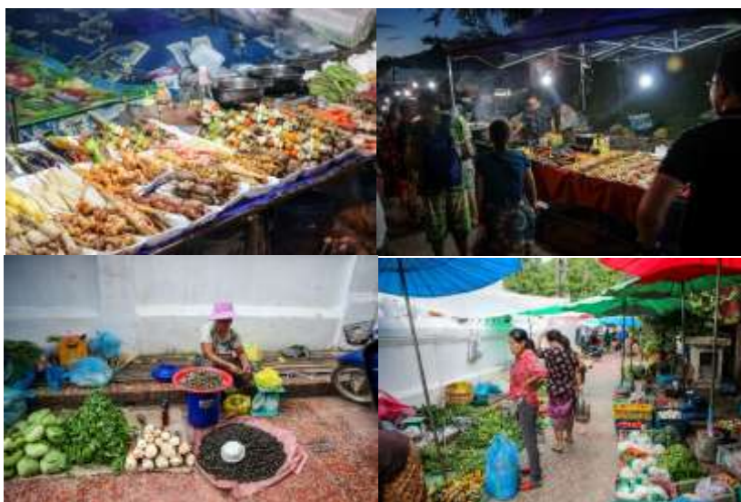
ภาพที่ 10 ตลาดกลางคืน (2 ภาพบน) และตลาดเช้า (2 ภาพล่าง) เส้นทางการท่องเที่ยว ที่ หลวงพระบาง อันเป็นเอกลักษณ์และอยู่ในแผนการท่องเที่ยวของหลวงพระบาง (ภาพขณะนักวิจัย: 12-15 กรกฎาคม 2561)

จากภาพชุดที่ 7-8 การท่องเที่ยวเชิงวัฒนธรรมประเพณี ชุดที่ 9 สถาปัตยกรรมวัดในพระพุทธศาสนา และชุดที่ 10 สู่ถึงการจัดการท่องเที่ยวเกี่ยวกับวัฒนธรรมอาหาร การกิน