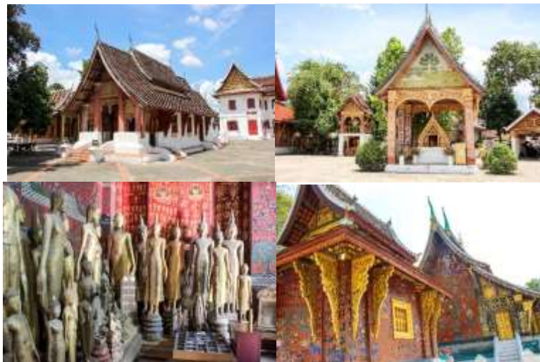
ภาพที่ 9 วิถีวัฒนธรรมทางศาสนาผ่านสถาปัตยกรรมที่ถูกออกแบบให้เป็นการท่องเที่ยว อาทิ วัดเชียงทอง วัดหนองสีคุณเมือง (ภาพขณะนักวิจัย: 12 กรกฎาคม 2561)