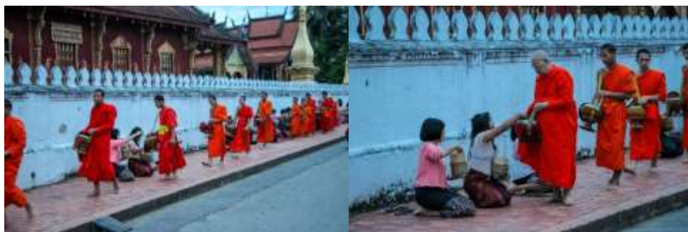
ภาพที่ 7 (ขวา-ซ้าย) การตักบาตรพระเช้าภาพวัฒนธรรมทางศาสนาของหลวงพระบางที่ถูก ออกแบบเป็นการท่องเที่ยวเชิงวัฒนธรรม (ภาพคณະนักวิจัย 12-15 กรกฎาคม 2561)

แลเคารพในบริบทของพื้นที่นั้นตามคติทางพระพุทธศาสนา ที่สอดคล้องกับ “Spiritual Tours” (UNWTO, 2013; John Holt, 2009) ที่ผ่านกระบวนการทางศาสนาสู่กลไกการพัฒนา แสดงออกผ่านสถาปัตยกรรม หรือประเพณีอันเนื่องด้วยศีลธรรมและจารีต สะท้อนผ่าน ประเพณีที่มีเป้าหมายเพื่อการควบคุมจริยธรรม ทั้งในเชิงบุคคลและสังคม จนกลายเป็นจารีต โดยมีฐานคติมาจากพระพุทธศาสนา หรือความเชื่อทางศาสนา ซึ่งแนวโน้มจะทำให้เห็นคุณค่า สิ่งประดิษฐ์สร้างทั้งสถาปัตยกรรมและประเพณีที่เนื่องด้วยการท่องเที่ยวด้วย