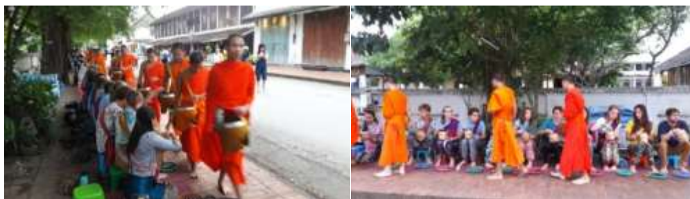
ภาพที่ 8 (ขวา-ซ้าย) วิถีวัฒนธรรมทางศาสนาที่ถูกจัดการเป้าหมายเพื่อการอนุรักษ์ รวมทั้งสะท้อนค่านิยมที่ต้องให้ความสำคัญและการแสดงออกอย่างเหมาะสม (ภาพคณະนักวิจัย, 12 กรกฎาคม 2561)