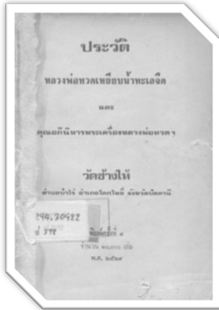
ภาพที่ 2 หนังสือรวบรวมประวัติหลวงปู่ทวดโดยวัดข้างไห้ในช่วงแรก ๆ

ปู่ทวดยังเป็นข้อถกเถียงด้วยมีหลายมติต่อปีเกิดของท่าน โดยข้อมูลประวัติยืนยันว่าท่านเป็นชาวบ้านวัดเลียบ ตำบลดีหลวง อำเภอสังขละ จังหวัดสงขลา เมื่ออายุได้ประมาณ 7 ขวบ บิดามารดาของท่านจึงนำท่านไปฝากไว้เป็นศิษย์วัดเพื่อเล่าเรียนหนังสือ โดยเข้ารับการศึกษาเล่าเรียนภาษาไทยและภาษาขอม จากนั้นทำการศึกษามูลบทบรรพกิจ เมื่ออายุได้ 15 ปีได้เข้ารับการบรรพชาเป็นสามเณร และบรรพชาอุปสมบทเป็นลำดับต่อมา ได้ศึกษาวิชาจากครูบาอาจารย์ต่าง ๆ จนมีความรู้และเป็นผู้ทรงอภิญญามาก และได้แสดงปาฏิหาริย์หลายครั้ง ได้รับพระราชทานสมณศักดิ์จากสมเด็จพระเอกาทศรถ (พ.ศ.2148-2153) ในราชทินนามที่ สมเด็จพระราชา牟尼สามิรามคณุปรมมาจารย์ จากนั้นได้กลับมาจำพรรษาที่วัดพะโคะ มรณภาพที่รัฐไทรบุรี ในมาเลเซีย และนำศพท่านกลับมาทำพิธีกรรมที่วัดข้างไห้ จ.ปัตตานี หลวงปู่ทวดเป็นพระภิกษุในพระพุทธศาสนา ที่ดำเนินวัตรปฏิบัติที่เป็นแบบอย่าง อันนำเคารพศรัทธาเลื่อมใสการที่หลวงปู่ทวดมีภูมิปัญญาเกิดอยู่ในภาคใต้ คือจังหวัดสงขลา มีประวัติที่เกี่ยวกับอภินิหาร มีข้อมูลเชิงประจักษ์ถึงความเป็นมนุษย์ที่มีอยู่จริงผ่านประวัติของวัดข้างไห้ จังหวัดปัตตานี หรือวัดพะโคะ จังหวัดสงขลา อันเป็นประวัติบ้านเกิดอยู่จำพรรษาของท่าน ทำให้หลวงปู่ทวดเป็นที่นับถือและยอมรับได้อย่างรวดเร็วในกลุ่มชาวจีนในประเทศสิงคโปร์ มาเลเซีย และอินโดนีเซียที่นับถือพระพุทธศานาหรือที่นับถือในเทพเจ้า เขียน ตามคติในแบบชาวจีน เช่น เจ้าแม่กวนอิม และเขียนต่าง ๆ จึงทำให้ง่ายต่อการรับอิทธิปาฏิหารของหลวงปู่ทวดที่ปรากฏเป็นข้อมูลในประวัติของท่าน