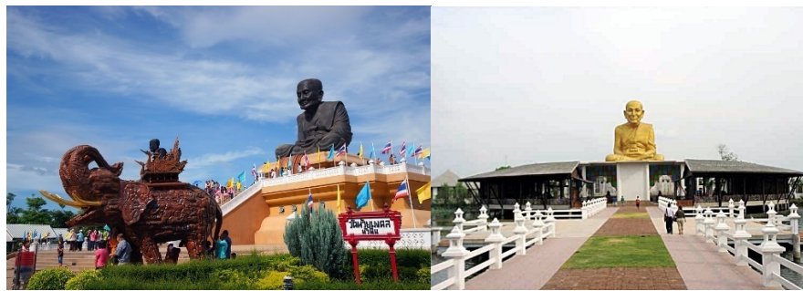
ภาพที่ 3 ภาพการก่อสร้างหลวงปู่ทวดองค์ใหญ่ ในประเทศไทย (วัดห้วยมงคล จ.ประจวบ, อุทยานหลวงปู่ทวด จ.พระนครศรีอยุธยา) เครื่องมือยืนยันต่อความเชื่อศรัทธาในหลวงปู่ทวดในกลุ่มชาวพุทธในประเทศมาเลเซีย สิงคโปร์ และอินโดนีเซีย

อินโดนีเซีย ยอมรับปฏิบัติและนำไปใช้ในการดำเนินชีวิต ส่วนใหญ่จะเริ่มจากการเชื่อ ศรัทธาต่อวัตถุมงคลของท่าน แล้วนำไปบูชา ปฏิบัติ ทั้งเห็นประสพผลจากประสบการณ์ตรงเชิงประจักษ์ต่อความเชื่อนั้น อาทิ นำไปใช้แล้วประสพผลสำเร็จตามที่ร้องขอ โดยมีวัดพุทธเถรวาทที่เกี่ยวข้องกับประเทศไทย มีปฏิสัมพันธ์กับพระภิกษุไทย นำไปเผยแพร่บอกต่ออย่างต่อเนื่อง จึงประหนึ่งเป็นช่องทางในการส่งผ่านวัตรปฏิบัติที่มาพร้อมกับวัตถุมงคลของหลวงปู่ทวด เช่น มีข้อห้าม ซึ่งเป็นคุณธรรม จริยธรรมทางศาสนา มีการสวดบูชา รวมไปถึงการให้ปฏิบัติตนตามหลักพระพุทธศาสนา ปัจจัยเริ่มต้นจึงเกิดจากความเชื่อศรัทธาในเรื่องเกี่ยวกับอภินิหาร ซึ่งพิจารณาเรื่องแล้วจะคล้ายกับเขียนตามความเชื่อของชาวจีน และการอ้อนวอนร้องขอที่ส่งผลเป็นความสำเร็จ จึงทำให้ชาวจีนเหล่านั้นประสพความสำเร็จในการดำเนินชีวิตที่ดี มีคุณค่าต่อการดำเนินชีวิต ซึ่งอาจเรียกได้ว่าเป็น “ปฏิสัมพันธ์ทางศาสนา” (นพรัตน์ ไชยชนะ, ศรีสุพร ปิยรัตน์วงศ์, 2555 : 2) โดยมีหลวงปู่ทวดเป็นกลไกร่วมของความนับถือศรัทธาต่อศาสนิกในประชาคมอาเซียนทั้ง 3 ประเทศที่นำมาเป็นกรณีศึกษา