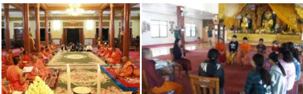
Figure 6 : บทบาทบัณฑิตจากมหาวิทยาลัยสงฆ์ไทยต่อสังคมพุทธนานาชาติ อาทิ วัดในกัมพูชา กับบทบาทของบัณฑิต มจร ที่วัดอุณาโลม กัมพูชา (ซ้าย) บทบาทบัณฑิต มจร กับการจัดการศึกษาที่โรงเรียน SYI วัดยางบอน รัฐฉาน พม่า (ขวา) กับการดำเนินกิจกรรมร่วมกับชุมชนชาวพุทธในประเทศของตนเอง

3. ทรัพยากรมนุษย์ในพระพุทธศาสนากับเครือข่ายพระพุทธศาสนา หมายถึง การที่มหาวิทยาลัยจัดการศึกษาเพื่อพัฒนาคนในเชิงปัจเจก พัฒนาคนในเชิงของการสร้างงานในชุมชนอันเป็นที่ตั้งของนิสิตผู้มา หรือ การนำความรู้ไปพัฒนาชุมชนที่นิสิตผู้ไปทำงานแล้ว การจัดการศึกษายังทำให้เกิดการสร้างเครือข่าย สร้างงาน พระพุทธศาสนาร่วมกันระหว่างสมาชิกในพระพุทธศาสนา ดังปรากฏการที่มหาวิทยาลัยจัดประชุมสัมมนาในระดับนานาชาติ ทำให้เกิดเครือข่ายในภาพกว้างระหว่างองค์กรต่อองค์กร ระหว่างสมาชิกในศาสนาต่อศาสนา รวมไปถึงเมื่อบัณฑิตที่จบการศึกษาไปในระดับปัจเจก ทำงานในชุมชนของตนเอง ก็ทำให้เกิดเครือข่ายการสร้างงานพระพุทธศาสนาร่วมกัน ดังกรณีนิสิตที่จบการศึกษาไปแล้วเกิดการเชื่อมโยงระหว่างเครือข่ายภายในระหว่างกันและกันเอง ทำให้เกิดภาคีเครือข่ายทางพระพุทธศาสนาร่วมกัน ซ้อนเป็นเครือข่ายในภาพกว้างระหว่างพระพุทธศาสนาด้วยกัน เป็นระหว่างนิกาย ดังกรณีพุทธเถรวาท กับพุทธมหายานนานาชาติ หรือระหว่างประเทศจากประเทศหนึ่งสู่ประเทศหนึ่ง ดังที่มหาวิทยาลัยมหาจุฬาลงกรณราชวิทยาลัยได้มีสถาบันสมทบในประเทศต่างๆ เป็นต้น ดังที่ผู้เขียนได้พบพระภิกษุชาวไทยใหญ่ พม่า ลาว ก็มีเครือข่ายทั้งในเชิงบุคคล นิกาย และประเทศเพิ่มขึ้น หรือการที่ผู้เขียนเคยไปพบพระธรรมทูตไทยในสหรัฐอเมริกา อังกฤษ หรือประเทศอื่น ๆ ในชุมชนชาวพุทธ ก็จะสามารถทำงานร่วมกันระหว่างนิกาย ระหว่างประเทศร่วมกันได้ไม่กว้างด้วยโดยมีมหาวิทยาลัยสงฆ์ไทยเป็นจุดเชื่อมและหลอมรวมความเป็นพหุวัฒนธรรม และสังคมนานาชาติสู่ความเป็นประชาชาติตามกรอบของการจัดการศึกษาได้ด้วย