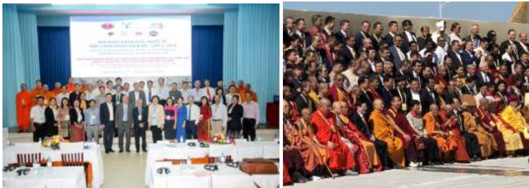
Figure 4 : บทบาทผู้บริหารกับการประสานสร้างเครือข่ายระหว่างมหาวิทยาลัย กับสังคัมพุทธนานาชาติ (Left) MOU and International Conference & University in Vietnam 6 th December 2018 (Right) 5th World Buddhist Forum, Putian, Fujian province, 29 of October, 2018

จากภาพที่ 3 บทบาทของมหาวิทยาลัยส่งเสริมกับการจัดการศึกษาเพื่อรองรับการพัฒนาทรัพยากรมนุษย์ในพระพุทธศาสนา โดยมีผู้มาเรียนโดยเฉพาะในกลุ่มประเทศพระพุทธศาสนา จำนวนมากจากจำนวนสถิติที่มีนิสิตมาเรียนจากประเทศต่าง ๆ ในปีการศึกษาปัจจุบัน มีชาวต่างชาติกว่า 1400 รูป/คน ตามสถิติที่ปรากฏในภาพ 2 โดยมีผู้เรียนทั้งภาษาไทย และภาษาอังกฤษ ในองค์กรวมมหาวิทยาลัยจัดการศึกษาเพื่อพัฒนาทรัพยากรมนุษย์ของประเทศ รวมไปถึงการพัฒนาทรัพยากรมนุษย์ในพระพุทธศาสนาทั้งในประเทศไทย และนานาชาติที่รับการศึกษา รวมทั้งเป็นภาคีแห่งรัฐในการจัดการศึกษาในองค์กรวมร่วมกับประชาคมอื่น ๆ ดังกรณีมีมหาวิทยาลัยสมทบหลายแห่งในหลายประเทศ อาทิ สิงคโปร์ ฮังการี ศรีลังกา เกาหลีใต้หวัน เป็นต้น โดยในส่วนของเครือข่ายผู้บริหารมหาวิทยาลัยได้ดำเนินการประสานและสร้างเครือข่ายระหว่างประชาคมชาวพุทธประชาคมมหาวิทยาลัย และประชาคมมหาวิทยาลัยพระพุทธศาสนาเพื่อเข้าไปเป็นส่วนหนึ่งในการผลักดันหรือขับเคลื่อนกิจการพระพุทธศาสนาร่วมกัน