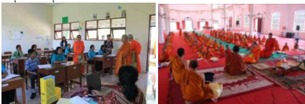
Figure 7 : บทบาทบัณฑิตจากมหาวิทยาลัยสงฆ์ไทยต่อสังคมพุทธนานาชาติ อาทิ การจัดการศึกษาที่ Smaratungga Buddhist College, Semarang, Jawa Tengah, Indonesia (ซ้าย) บทบาทบัณฑิต มจร จัดการศึกษาที่โรงเรียนวัดภูควาย หลวงพระบาง ลาว (ขวา) บัณฑิตกับบทบาทการพัฒนาร่วมกับชุมชนชาวพุทธในประเทศของตนเอง

การพัฒนาคนในพระพุทธศาสนา ทำให้เกิดการเรียนรู้กลายเป็นกลไกการพัฒนาสังคมนานาชาติในแบบพระพุทธศาสนา ดังกรณีนิสิตเข้ามาศึกษาที่มหาวิทยาลัยพระพุทธศาสนาไทย จะมีผลได้ 2 กรณีเป็นเบื้องต้นคือ (1) ผู้มาเรียนได้องค์ความรู้เกี่ยวกับพระพุทธศาสนาเป็นการพัฒนาตนตามกรอบของการพัฒนาบัณฑิตของมหาวิทยาลัย (2) นิสิตผู้เรียนได้พัฒนาองค์ความรู้ในชุมชนของตนเองให้เป็นความรู้สาธารณะผ่านการวิจัยหรือวิทยานิพนธ์ที่นิสิตได้ ทำและพัฒนาเป็นฐานองค์ความรู้ในชุมชนและประเทศนั้น ๆ อาทิ พุทธศาสนาในลาว กัมพูชา เวียดนาม พม่า เป็นต้น นับเป็นองค์ความรู้เกี่ยวกับพระพุทธศาสนาเชิงพื้นที่ (Area Studies) ในประเทศนั้น ๆ รวมทั้งเป็นการสื่อสารพระพุทธศาสนาสู่สังคมนานาชาติทำให้เกิดการแลกเปลี่ยนทำให้เกิดการเรียนรู้ ทำให้เกิดเครือข่ายสังคมประชาชาติ จนกระทั่งกลายเป็นกลไกร่วมของการพัฒนาทรัพยากรมนุษย์ในพระพุทธศาสนาด้วย