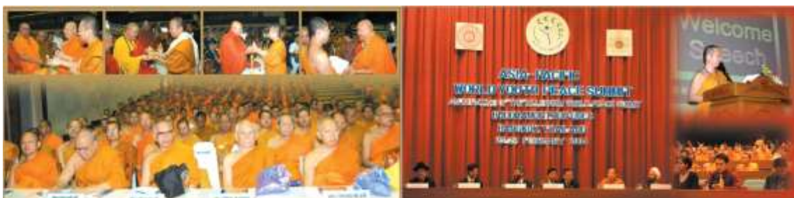
Figure 1 บทบาทมหาวิทยาลัยพระพุทธศาสนาไทยในการจัดการศึกษา และจัดประชุมในระดับนานาชาติ เพื่อส่งเสริมการ พัฒนาการพระภิกษุสงฆ์ในพระพุทธศาสนา (Figure 1 Mcu Online, 10 October 2018)

ดังนั้นหากศึกษาถึงพัฒนาการของมหาวิทยาลัยสงฆ์ และบทบาทของมหาวิทยาลัยคือการจัดการศึกษา เพื่อพัฒนาบุคลากรทางด้านพระพุทธศาสนาให้กับพระพุทธศาสนาในประเทศไทย โดยรูปแบบของการศึกษา การศึกษาสงฆ์ของมหาวิทยาลัยทั้ง 2 แห่ง นับเป็นพัฒนาการทางการศึกษาสงฆ์และประเทศไทยที่มาพร้อมกับการเข้ามาของอาณานิคมตะวันตก ที่มีผลทำให้ประเทศต่าง ๆ ในโลกและเอเชียตะวันออกเฉียงใต้อย่าง ประเทศไทยต้องปรับตัวด้านต่าง ๆ ทั้งในด้านการเมือง เศรษฐกิจ สังคม วัฒนธรรม และการศึกษาด้วย โดย จากหลักฐานที่ปรากฏมหาวิทยาลัยสงฆ์ทั้ง 2 แห่งมีพันธกิจในเรื่องการจัดการศึกษาแต่ในเวลาเดียวกันก็ได้ พยายามจัดการศึกษาเพื่อส่งเสริมการประชาสัมพันธ์เผยแผ่พระพุทธศาสนา รวมทั้งทำให้มหาวิทยาลัยเป็นส่วน หนึ่งของการส่งเสริมความเข้มแข็งให้พระพุทธศาสนาในองค์รวม ดังกรณีที่มีการจัดการประชุมผู้นำชาวพุทธ จัดประชุมเครือข่ายทางด้านพระพุทธศาสนาระหว่างนิกายอื่น ๆ หรือศาสนาอื่น ๆ ในประเทศไทย นับหนึ่งเพื่อ เป็นการสร้างเครือข่าย นับหนึ่งเพื่อส่งเสริมการเรียนรู้ระหว่างมหาวิทยาลัยร่วมกัน ระหว่างพระพุทธศาสนา นิกายต่าง ๆ ในนานาประเทศ รวมทั้งมีการจัดการศึกษาเพื่อส่งเสริมให้เกิดการศึกษาพระพุทธศาสนาร่วมกัน ด้วย