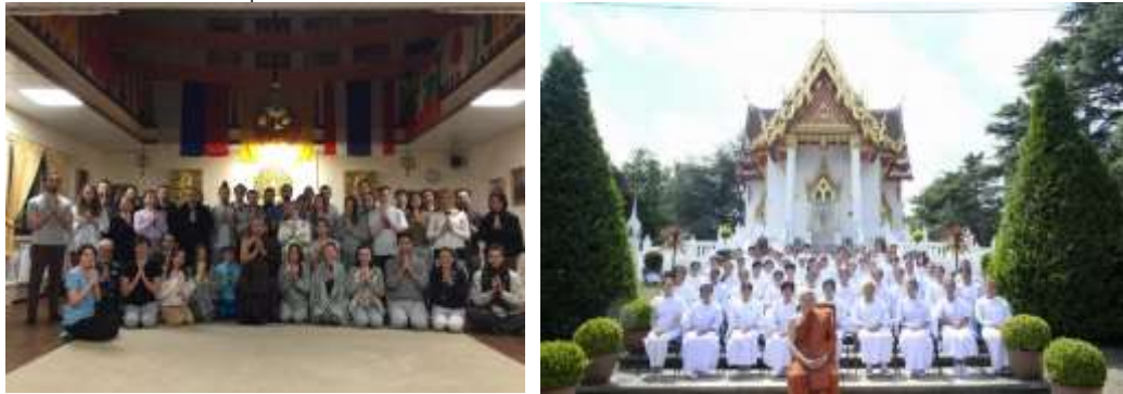
Figure 5 : บทบาทพระธรรมทูตไทยภายใต้การจัดการศึกษาโดยมหาวิทยาลัยสงฆ์ไทย ต่อบทบาทในการพัฒนาในสังคมนานาชาติ อาทิ วัดอภิธรรมพุทธวิหาร วัดไทยในรัสเซีย (ซ้าย) วัดพุทธประทีป วัดไทยในอังกฤษ (ขวา) กกับการดำเนินกิจกรรมร่วมกับชุมชนชาวพุทธและชาวไทยในประเทศนั้น

เสียสละเพื่อส่วนรวม (H = Hospitality) มีโลกทัศน์ กว้างไกล (U = Universality) เป็นผู้นำด้านจิตใจและปัญญา (L = Leadership) ศักยภาพที่จะพัฒนาตนเอง ให้เทียบพร้อมด้วยคุณธรรมและจริยธรรม (A = Aspiration) ทั้งหมดเป็นเป้าหมายของมหาวิทยาลัยสงฆ์ไทย เพื่อให้ทรัพยากรมนุษย์ในพระพุทธศาสนาในเชิงบุคคล ให้ได้รับการพัฒนาอย่างมีเป้าหมาย และนำความรู้กลับไปพัฒนางาน สร้างงานในพระพุทธศาสนา ในชุมชนที่ตัวเองอยู่อาศัย ในประเทศนั้น ๆ หรือนำไปพัฒนาในสังคมอื่น หรือชุมชนนานาชาติอื่นในประเทศปลายทาง ทั้งพุทธเถรวาท มหายาน วัชรยาน ในแบบที่ตัวเองดำเนินการอยู่และเป็นพร้อมทั้งส่งเสริมให้เกิดการขับเคลื่อนต่อความเป็นพระพุทธศาสนาในองค์กรร่วมด้วย